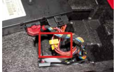
Anbringen der beiden Abgreifklammern für die Stromversorgung des Moduls.

Für die Stromversorgung des topcomfort™ Moduls werden Abgreifklammern an zwei Kabeln des schwarzen Steckers angebracht. Die Kabelbäume sind mit einem Textilband umwickelt. Entfernen Sie das Band auf ca. 5cm Länge vor dem Steckergehäuse. Das erleichtert Ihnen das Anbringen der Abgreifklammer.