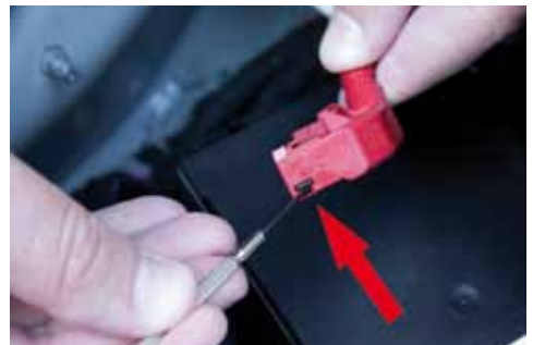
Kabelbinder entfernen. Rasthaken entriegeln, dann Buchsenleisten aus dem Steckergehäuse ziehen.

In dem abgezogenen Steckergehäuse befindet sich eine Buchsenleiste. Um diese aus dem Steckergehäuse zu entnehmen, wird zuerst der Kabelbinder am Steckerhals mit einem Seitenschneider entfernt. Entriegeln Sie den Rasthaken an der schmalen Seite mit einem kleinen Schraubendreher, dann kann die Buchsenleiste aus dem Gehäuse gezogen werden.